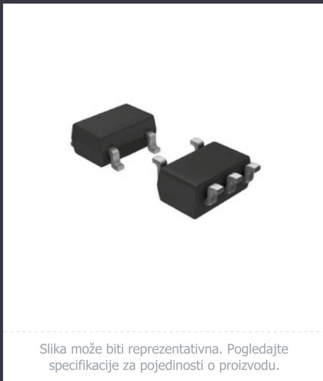
Slika može biti reprezentativna. Pogledajte specifikacije za pojedinosti o proizvodu.