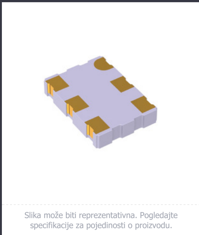
Slika može biti reprezentativna. Pogledajte specifikacije za pojedinosti o proizvodu.