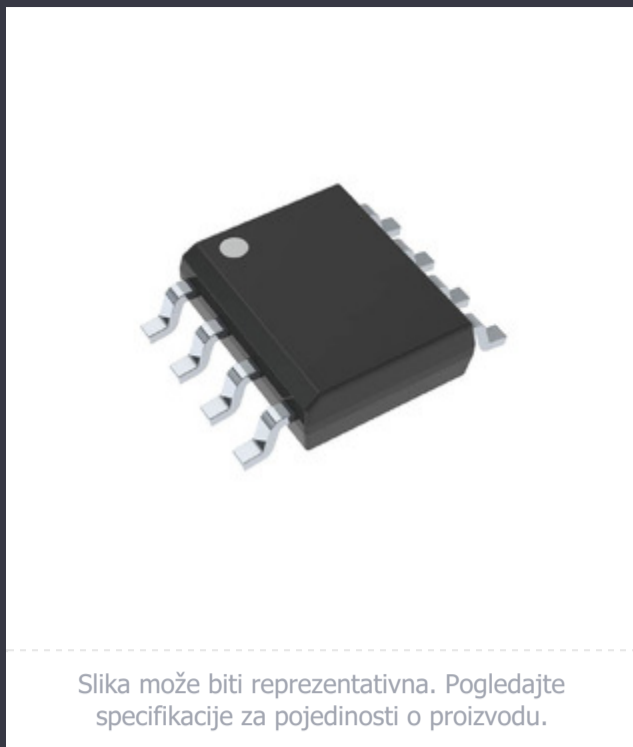
Slika može biti reprezentativna. Pogledajte specifikacije za pojedinosti o proizvodu.