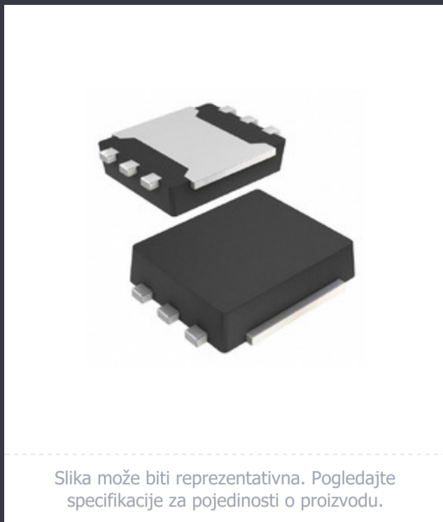
Slika može biti reprezentativna. Pogledajte specifikacije za pojedinosti o proizvodu.